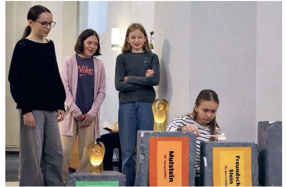
Am Palmsonntag wurde in Malters und Schwarzenberg der Einzug Jesu in Jerusalem lebendig gefeiert. In beiden Pfarreien trugen Drittklässler einen Palmbaum in die Kirche. «Stolpersteine» als Lebensherausforderungen thematisierten dazu Schülerinnen der 6. Klasse in Schwarzenberg (oben rechts).