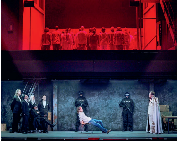
Während Pilatus (rechts) auf der unteren Bühne Jesus (Mitte) verhört, schreit die Menge oben «Kreuzige ihn!».

die Höhe gehoben. Dadurch sind sowohl die Menschenmenge wie der Gerichtshof mit Pilatus, Jesus und den Hohepriestern sichtbar. Oben schreit die Menge immer lauter: «Crucify him!» (Kreuzige ihn!) Unter dieser toben- den Menge schweigt Jesus selbst dann noch, als er ausgepeitscht wird – im Stück vor allem akustisch und durch die Zuckungen der Tänzer:innen auf der oberen Bühne verdeutlicht.