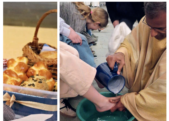
Am Hohen Donnerstag fand die traditionelle Fusswaschung der Erstkommunikanten vor dem letzten Abendmahl statt. In Schwarzenberg wurde mitgebrachtes Brot gesegnet.