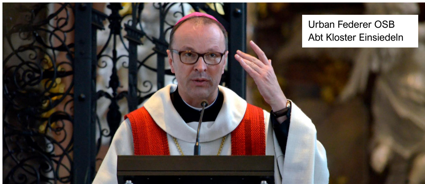
Urban Federer OSB Abt Kloster Einsiedeln

WICHTIGSTE DATEN DER « ZENTRALE » PFLICHT-WEG